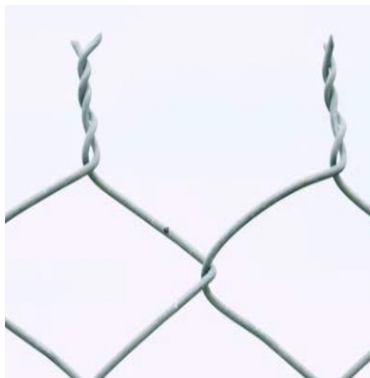
Mailles losangées – bordure torsadée

Alt Text - La figure 1 illustre une clôture de type "knuckle edge" où les bords supérieurs de la clôture sont repliés et tordus ensemble.