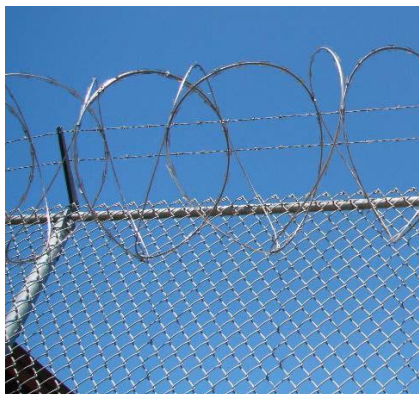
Barbelé à boudin hélicoïdal soutenu par un barbelé