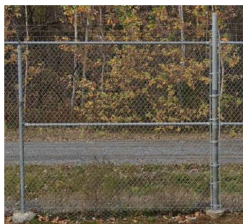
Grillage surmonté d'un barbelé à trois fils avec bordure torsadée et barre de tension

Alt Text - La figure 1 représente un gros plan d'une barbe de fil de fer barbelé qui est construite à partir de 2 brins de fil avec de petits morceaux pointus de fil torsadé pointant vers l'extérieur à de courts intervalles.