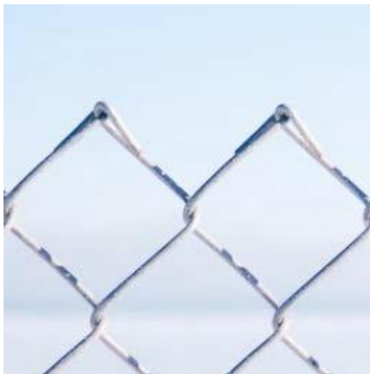
Mailles losangées – bordure repliée