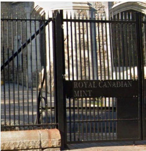
La figure 1 - Barreaux verticaux à ouvertures étroites, à base

Il convient de sécuriser les charnières et les pièces d'assemblage par procédé de durcissement par écrouissage superficiel ou de soudage, là où le niveau de protection le justifie, afin de prévenir le démontage des composants des clôtures et des barrières.