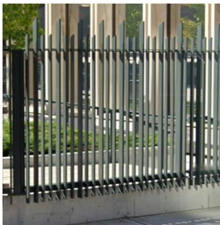
Panneau à barreaux verticaux longs sur base

Pour les clôtures de haute sécurité fabriqués de matériaux continus, il faut utiliser du fil de calibre AWG 9 pour fixer le matériau aux poteaux et aux traverses. L'espace entre les points de fixation ne doit pas dépasser 300mm.