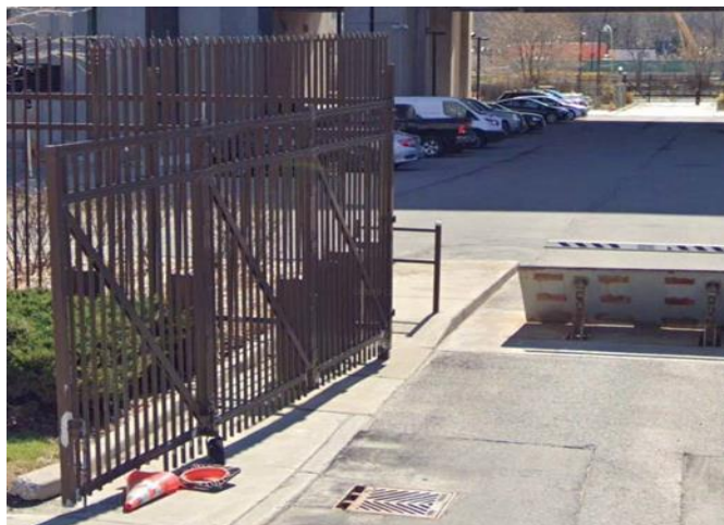
La figure 3 - Barrière à barreaux renforcée par un dispositif de sécurité anti-véhicules béliers

Alt Text – La figure 1 représente une clôture avec une porte d'accès à la Monnaie royale canadienne. La toile du panneau est constituée de poteaux étroits fixés au béton et la barrière est dotée d'une base étendue. Il y a un arrêt de véhicule derrière la barrière.